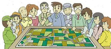
地域ぐるみでの話し合い