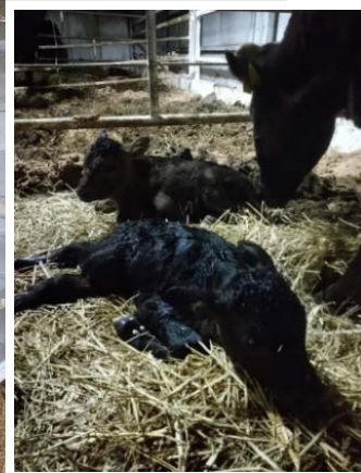
生まれたばかりの子牛