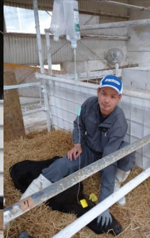
点滴のための保定