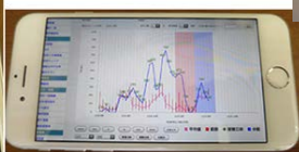
スマートフォンでグラフを確認