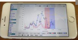
スマートフォンでグラフを確認