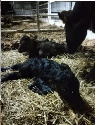
生まれたばかりの子牛