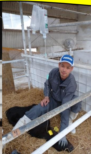
点滴のための保定